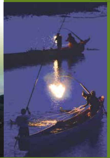
鸬鹚匠与船工气息相投一起掌船