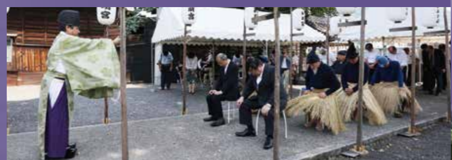
在神明神社的香鱼供养