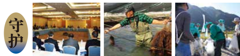
全国鸕鷀捕鱼峰会 香鱼的人工孵化 长良川的清扫活动