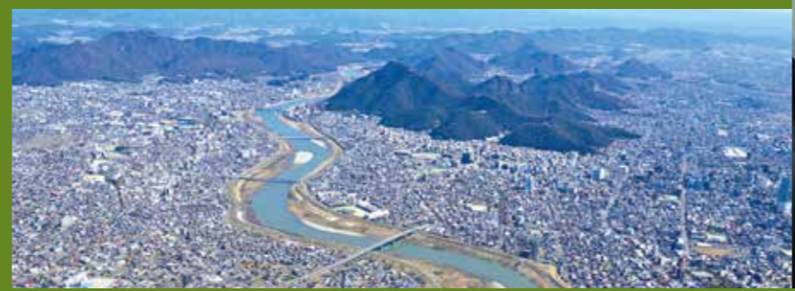
穿过城市的清流长良川