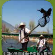
中国的鸬鹚捕鱼(云南省大理市)

地域 在日本，包括长良川在内，有12所地方进行鸬鹚捕鱼，在中国有100处以上的地方在进行鸬鹚捕鱼。