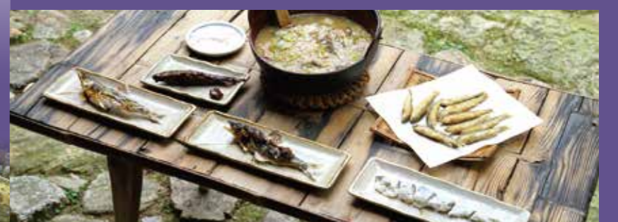
鸬鹚匠传统香鱼料理(香鱼寿司, 香鱼稀饭, 香鱼甘露煮)