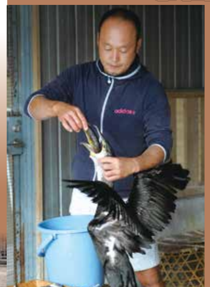
给鸬鹚喂食的鸬鹚匠