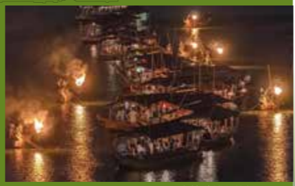
观赏鸬鹚捕鱼的样子

源头在大口岳发源的清流长良川，众多的沿岸居民栖居两岸。自然，城市，与人合为一体，在这个人与自然合二为一的风景中，观赏风雅的屋型船，体验人·鸬鹚·船浑然一体的岐阜独有的自然风光。