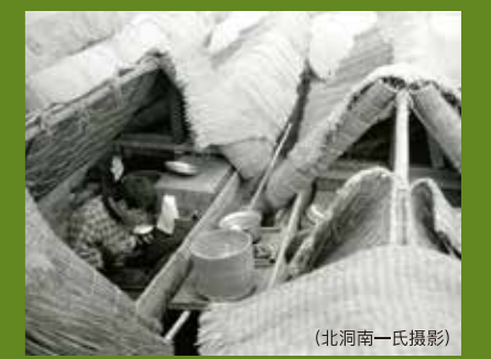
在停泊的船上一起吃饭的样子