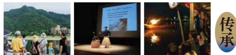
市民团体的宣传 在法国巴黎的宣传 小学生们促进鸕鷀捕鱼观光的活动