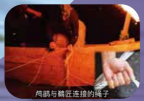
鸬鹚与鸬鹚匠连接的绳子