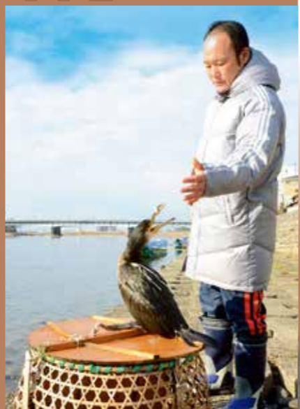
被送到新的鸬鹚匠处，进行鸬鹚的训练