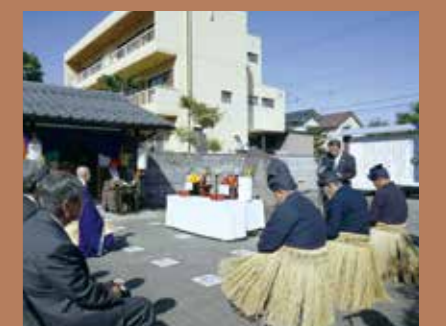
在鸬鹚的坟家供养鸬鹚