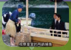
视察皇室的鸬鹚捕鱼

格式 岐阜市长良有6名，关市小濑有3名被任命的“宫内厅式部职鸬鹚”，每年8次进行献给宫内厅的鸬鹚捕鱼。