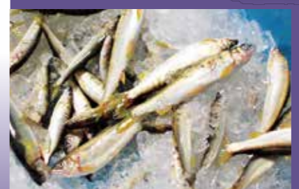
在鸬鹚捕鱼开幕这天捕获的天然香鱼

香鱼，自古以来就是日本人熟悉的河鱼。现在，长良川在日本的香鱼捕获量屈指可数。其中，用鸬鹚捕获的香鱼鲜度最高，十分珍贵。