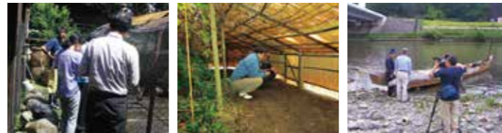
听取调查 現地调查 记录影像的摄影